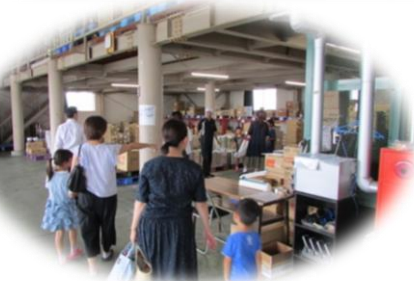
学校給食会の 倉庫見学も行いました。