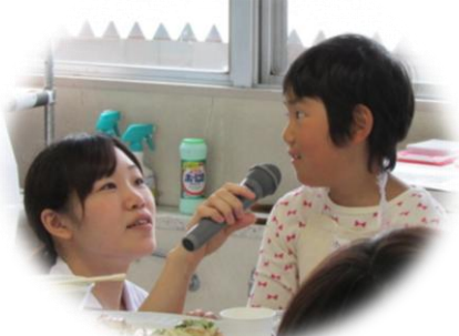
実習や講義の感想を 発表してもらいました