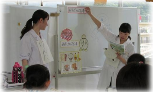
朝ごはんの役割や、実習で使った 夏野菜についても学びました。