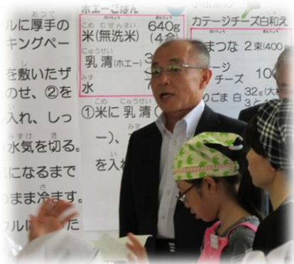
常務理事あいさつ